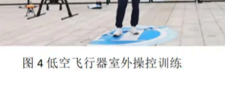
图4 低空飞行器室外操控训练