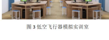
图3 低空飞行器模拟实训室